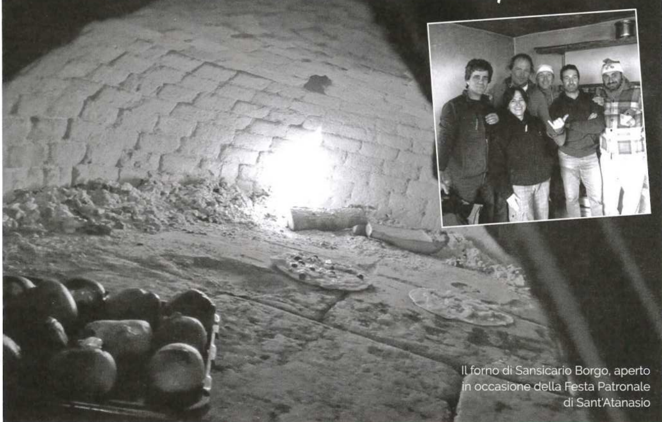
Il forno di Sansicario Borgo, aperto in occasione della Festa Patronale di Sant'Atanasio

... la memoria storica che non deve scomparire